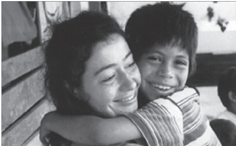
Dal fascicolo di presentazione dell'Associazione: "Punto Cuore".

Mamma, papà... vorrei stare via un anno, per donarmi agli altri. E mamma e papà avvertono un immediato tuffo al cuore: come non averlo?