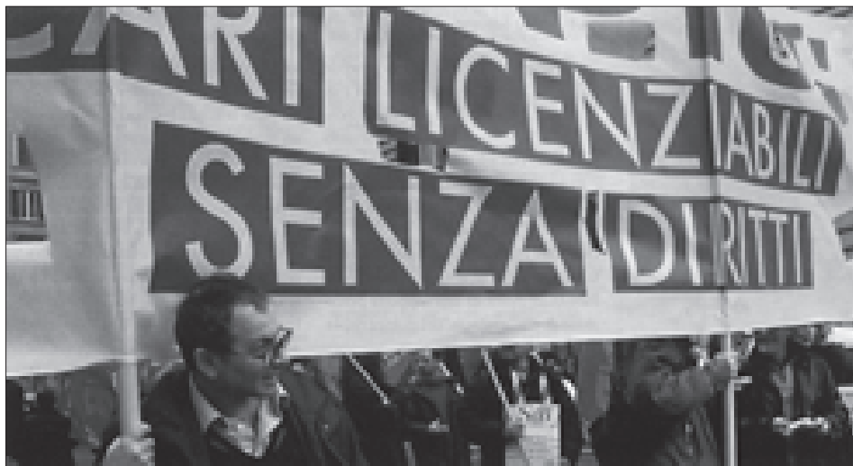
Una manifestazione di lavoratori precari.