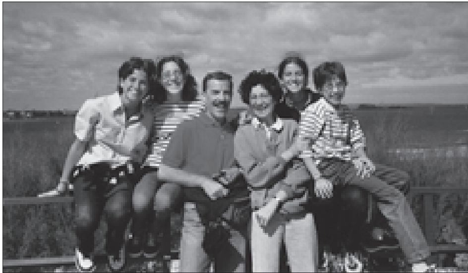
Una "bella" famiglia.

Specchiarsi nell'intimo di Dio per recuperare il senso profondo dell'essere famiglia e per lanciarsi nelle strade del mondo.