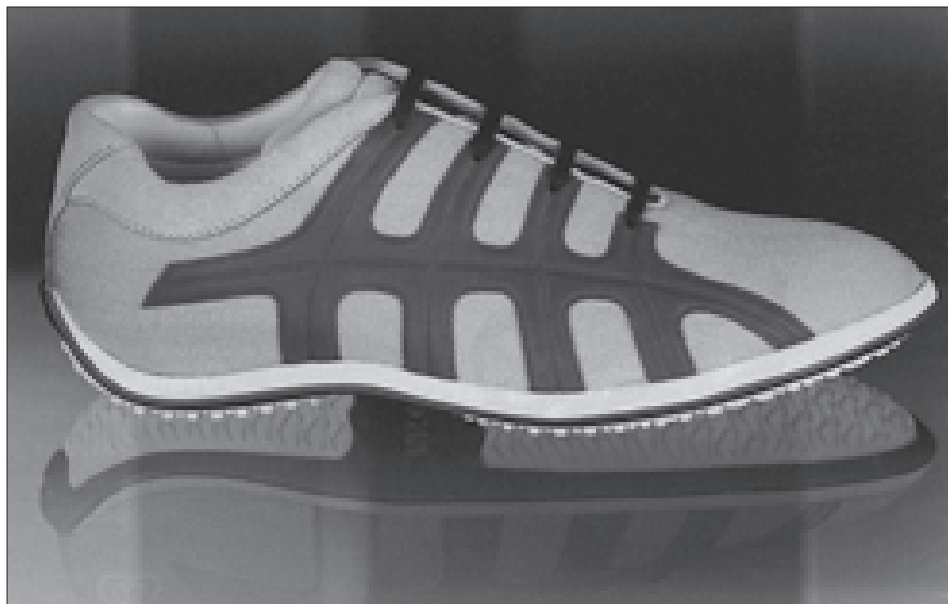
La pubblicità di una scarpa da ginnastica "griffata".

Quella mamma ora non prende più psicofarmaci e gode di buona salute. La cura è stata la solidarietà e la creatività di un'assistente sociale in collaborazione con un gruppo di famiglie affidatarie: insieme abbiamo realizzato un modo nuovo di fare affidamento.