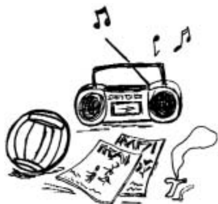
disegno di Giuliana Berardo

Se il luogo eminente del disegno salvifico di Dio è la Chiesa cattolica, tuttavia altre religioni sono anch'esse riflessi, sia pure parziali, dell'unica Parola di Dio.