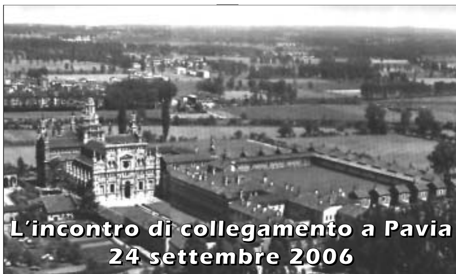
La Certosa di Pavia (dal sito: www.comune.pv.it/certosadipavia/home.htm)

Molti campi sono, in tutto o in parte, autogestiti; viene perciò richiesta la collaborazione di ogni famiglia per il loro buon funzionamento.