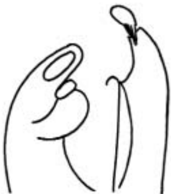
disegno di Giuliana Berardo

Il terzo riguarda l' accoglienza di chi vive situazioni matrimoniali difficili , facendosi prossimi per annunciare la consolazione del Signore, e fornendo sostegno psicologico, attenzioni, tempo.