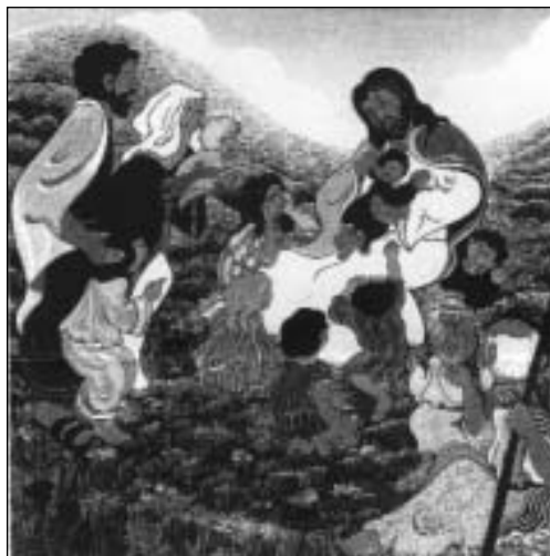
Il disegno di copertina del Catechismo dei Bambini

Amare i figli non è adorarli, essere al loro servizio, non lasciarli mai, metterli in cima ai propri pensieri.