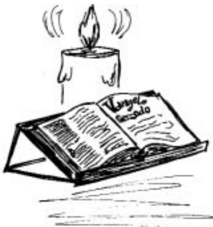
disegno di Giuliana Berardo

Non esistono formule valide per tutti, si può dare solo qualche indicazione di cammino. Per prima cosa si tratta di convincere il consiglio pastorale (CP) della