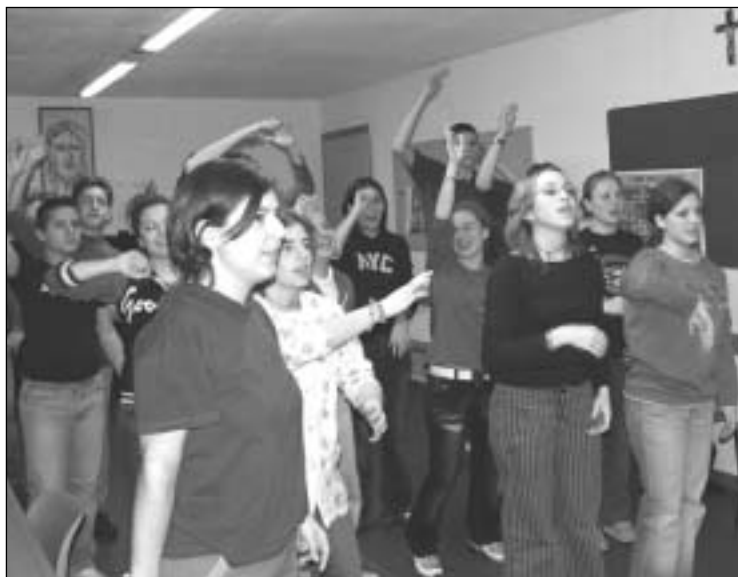
I giovani della parr. della Resurrezione (TO) in ritiro ad Ulzio