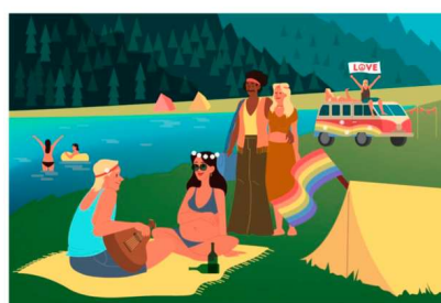
BABY BOOM GENERATION

Per i nati tra il 1945 e il 1964 si è soliti parlare di baby boomers. Questo termine, sviluppato in Nordamerica, indica quelle persone che hanno